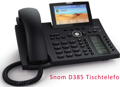
Snom D385 Tischtelefon

Die IT-Checker unterstützen sie gerne bei dieser Umstellung mit VOIP-Telefonie in Bestform . Überzeugen Sie sich selbst von einem Angebot, das punkto Funktionsumfang, Preis und Service seinesgleichen sucht!