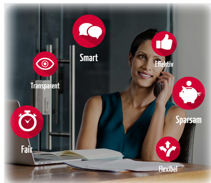
Einzigartiges Lizenzmodell in der Branche